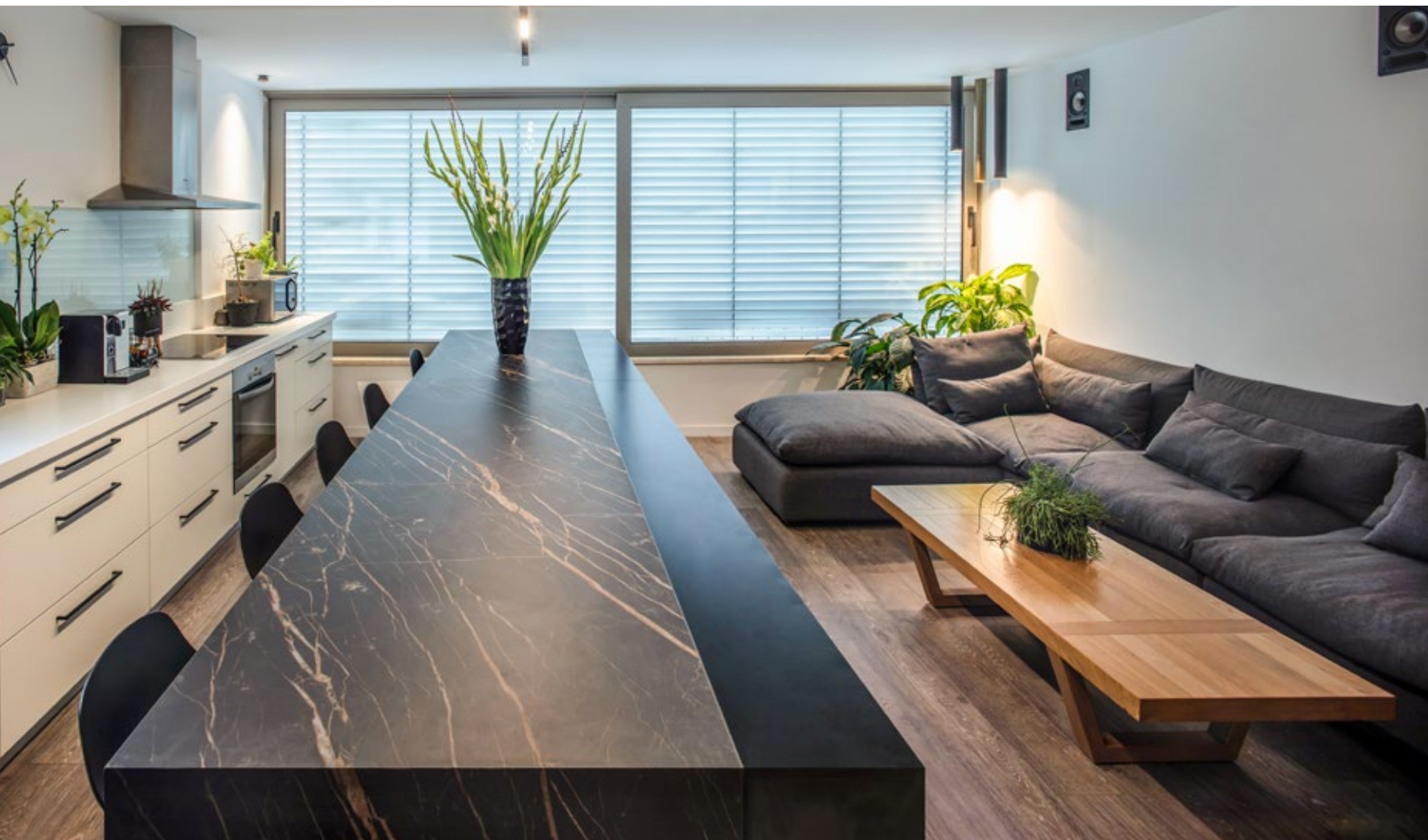
אלומיניום: ענק הזכוכית והאלומיניום